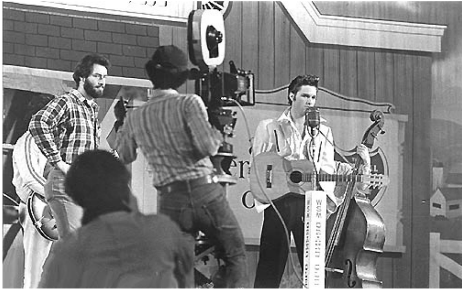
Acima Kurt Russel durante as gravações de “Elvis”