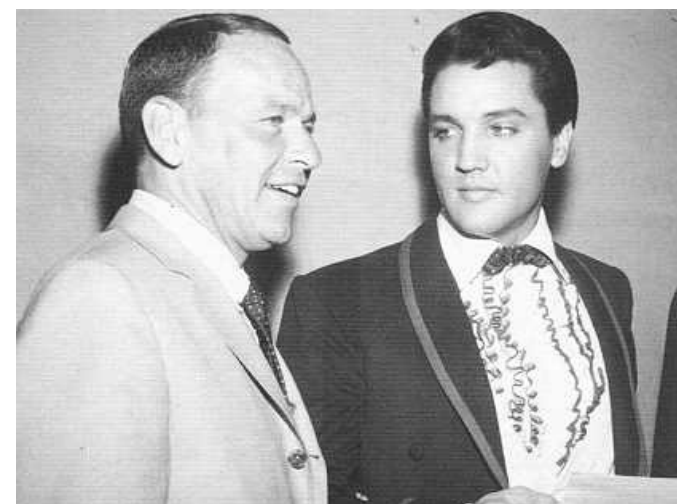
Sinatra e Elvis na década de 60