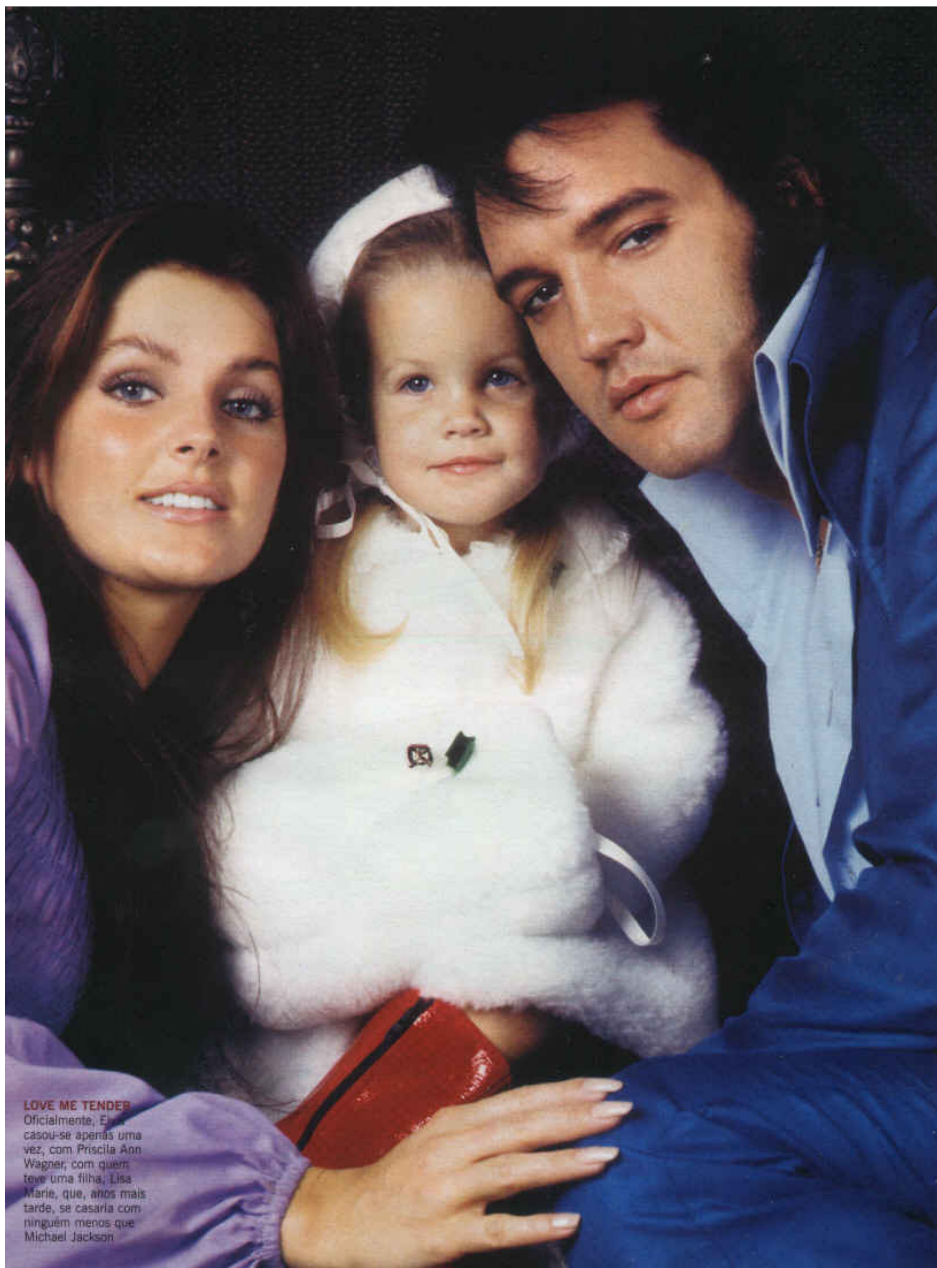
LOVE ME TENDER Oficialmente, Elvis casou-se apenas uma vez, com Priscilla Ann Wagner, com quem teve uma filha, Lisa Marie, que, anos mais tarde, se casaria com ninguém menos que Michael Jackson.