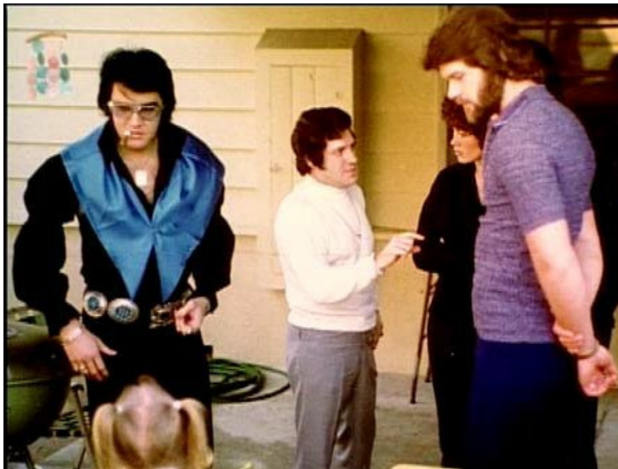
Elvis observa a pequenina Lisa durante um ensaio