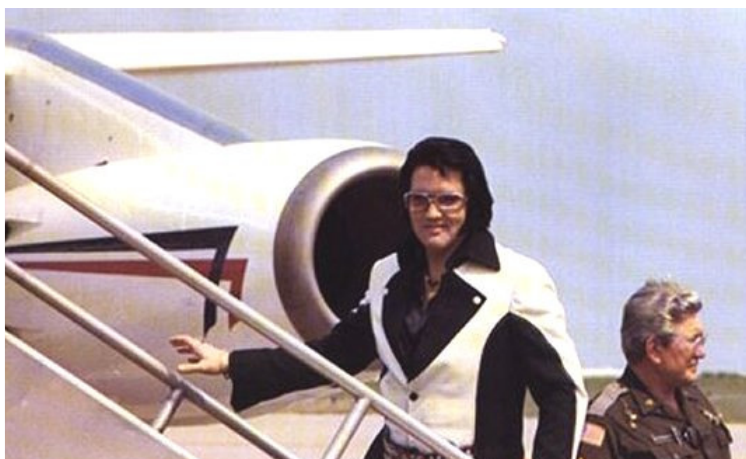
Elvis sempre olhava e acenava aos fãs antes de partir!