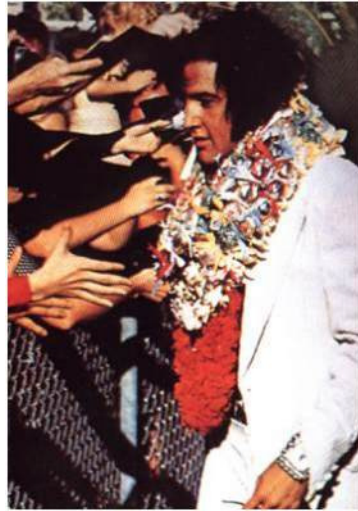
O Rei sendo recepcionado pelos fãs no heliporto (1973)