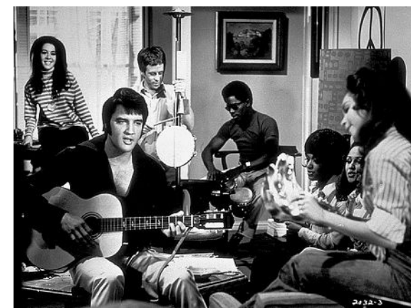
Elvis em 1969 durante o filme "Ele e as três noivas"