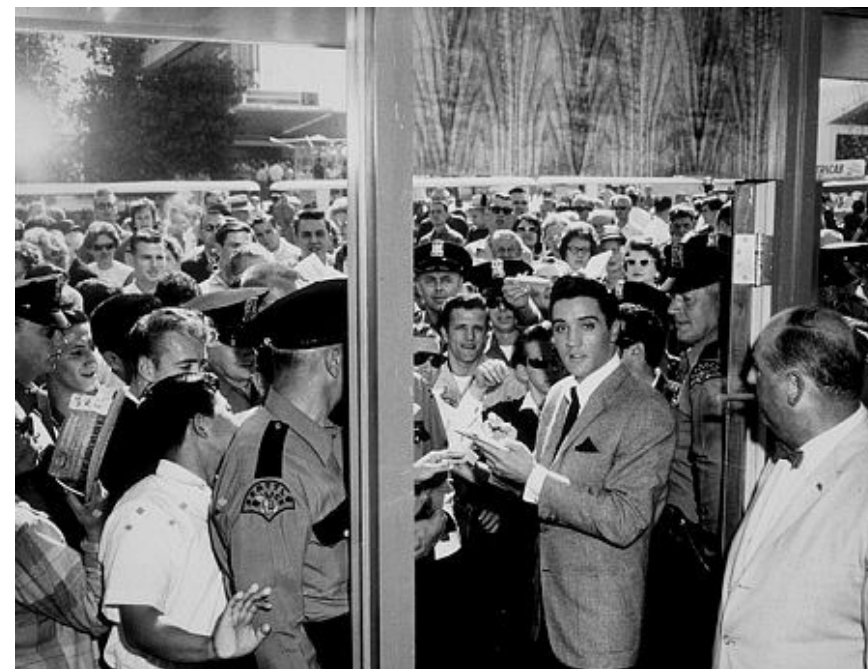
Elvis durante as filmagens de Loiras Ruivas e Morenas de 1963