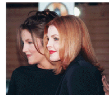
Lisa e Priscilla juntas

PRISCILLA PRESLEY: Ela queria começar a cantar, acho que há uns 10 anos atrás.. Eu tentei encorajá-la a tomar lições porque obviamente ela tinha, tinha a quem puxar.... risos... Minha preocupação era a de que ela simplesmente fizesse isso sem treinamento nenhum!. Eventualmente ela teve aulas de canto...mas para ser sincera eu sequer sei se ela precisava mesmo disso!