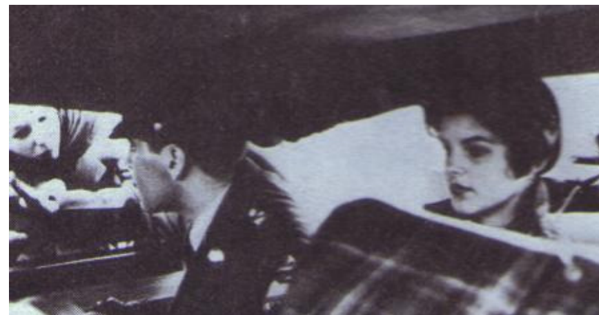
Elvis leva Priscilla até o aeroporto, sua despedida para os Estados Unidos

PRISCILLA PRESLEY: Não, não a esta altura. Era difícil porque ele poderia ligar a qualquer hora da noite... e nós falávamos 3, 4 horas ao telefone a cada ligação.